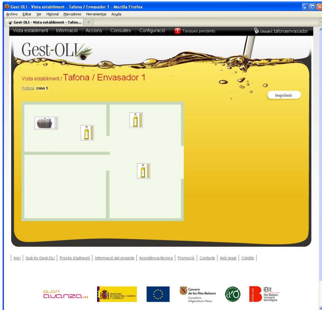
Imagen 4. Vista de la almazara.